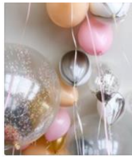
Шары от 45 рублей. Заходи! Группа