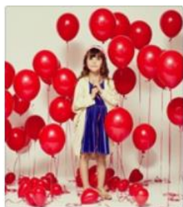
Большой выбор шаров с доставкой Группа