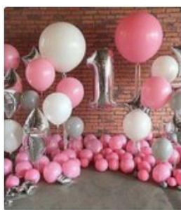
От 45 рублей за шарик. Жми! Группа